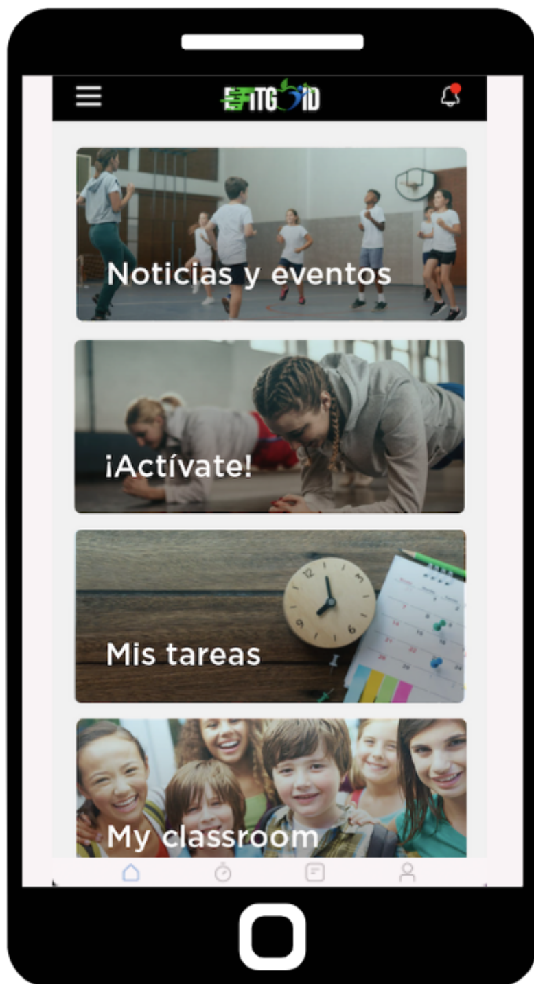
Prototipo de App

EFITGOID no solo es una herramienta específica para el docente, sino también para cualquier administración, institución u organismo regulador. Gracias a las sus funcionalidades específicas tendrán un control de la planificación , así como de seguimiento del área de EF e incluso una monitorización de la actividad física del alumnado . Además, esta herramienta permite una estructuración de la materia de EF de un propio centro educativo, pudiendo establecer una programación común basada en el currículo de cada comunidad. Este sistema permitiría tener un sistema de comunicación interna con docentes y alumnado , podría establecer retos y